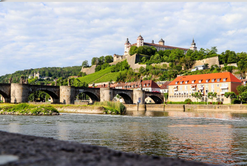
Die alte Mainbrücke in Würzburg