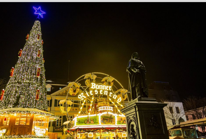
Weihnachtsmarkt in der Bonner Innenstadt

Die Chargia wünscht allen ein frohes und besinnliches Weihnachtsfest & einen guten Rutsch ins Neue Jahr!