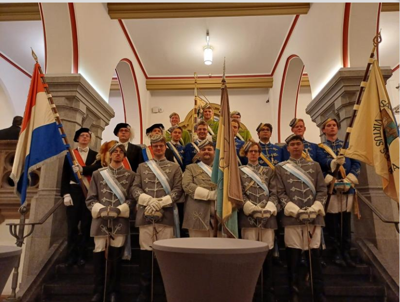
Die Chargierten Staufeu zum 120. Stiftungsfest