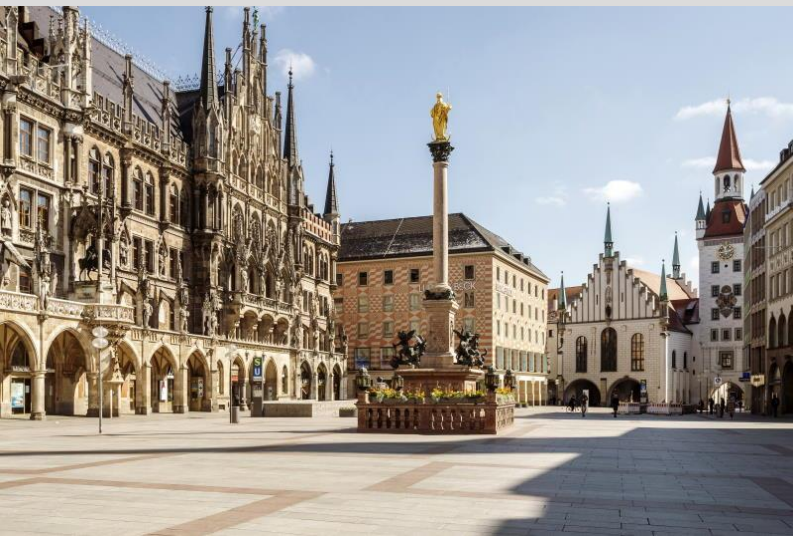
Der Marienplatz in München